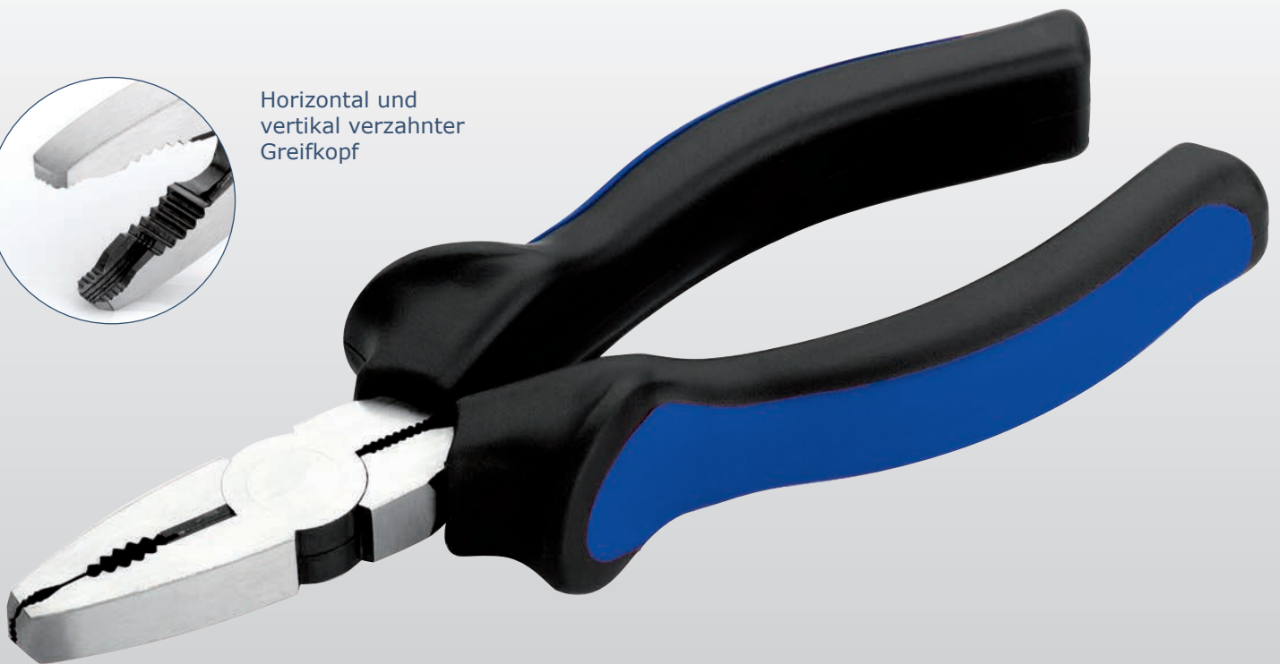
Frontales und seitliches Greifen von Schraubenköpfen möglich