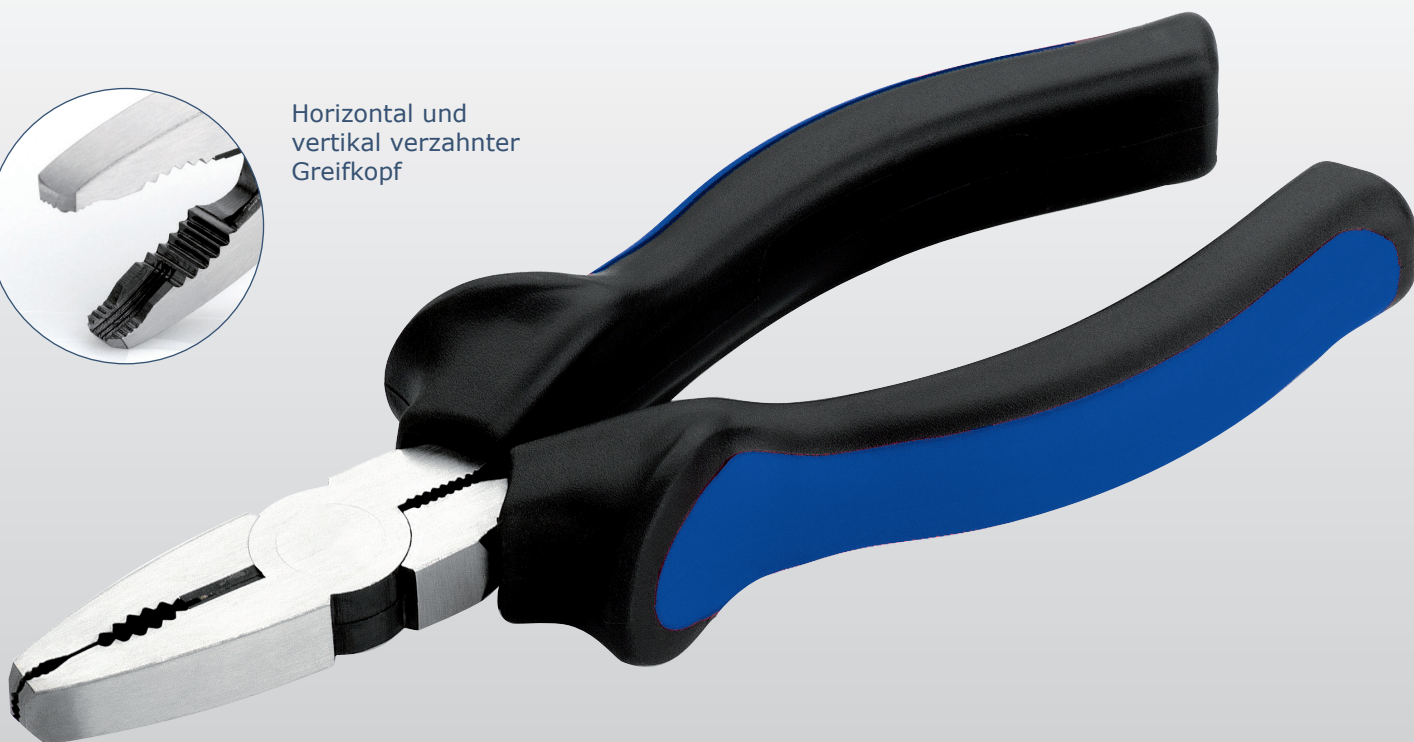
Frontales und seitliches Greifen von Schraubenköpfen möglich